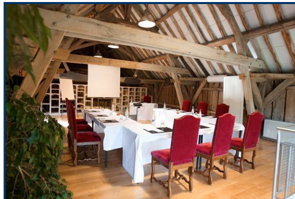
Le Comptoir, à l'entrée du site

Merci de nous contacter au +33 3 80 79 25 25 si vous n'avez pas reçu la totalité des pages