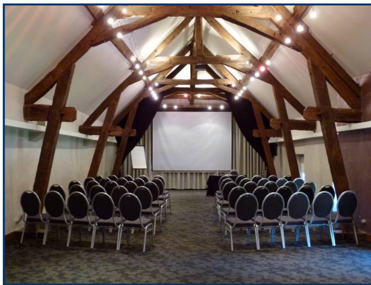
Le Clos, à l'étage du restaurant

Pour vos séminaires, un cadre unique au cœur de la Bourgogne !