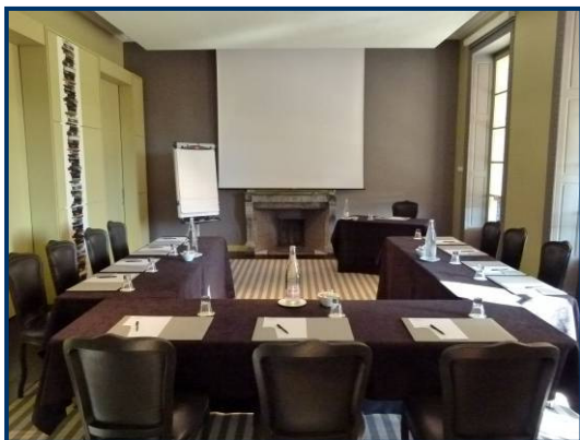
Salon Meursault, rez-de-chaussée du Château

Equipées de vidéoprojecteur, écran, paper-board, accès internet WIFI, TV-lecteur DVD et autre matériel sur demande.